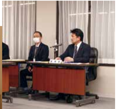
予算特別委員会 委員長

合葬墓の生前予約について 要望しました 月見野霊園合葬墓には、約2,000体の遺骨が保管可能な納骨室と約8,000体が埋葬可能な合葬墓が設置される予定です。