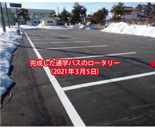
完成した通学バスのロータリー(2021年3月5日)