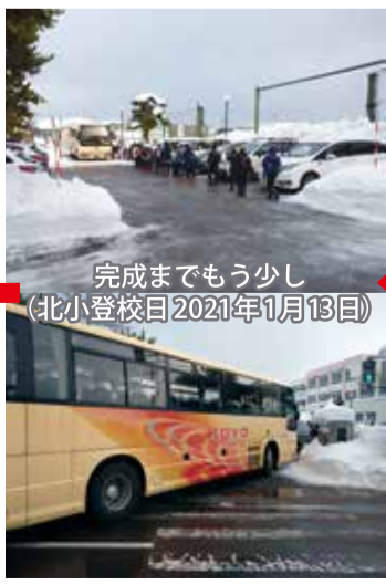
完成までもう少し(北小登校日2021年1月13日)