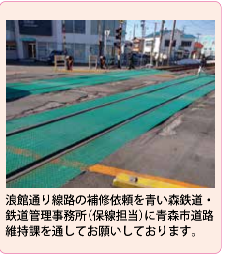
浪館通り線路の補修依頼を青い森鉄道・鉄道管理事務所(保線担当)に青森市道路維持課を通してお願いしております。

高田地区の融雪設備の 整備をお願いしました 高田地区・太陽台団地手前の坂の融雪設備は平成25年度から補修工事の要望の声が上がっています。毎年、気温が下がる初冬に融雪不備が発生しないように確認してほしいとお願ひしていましたが初冬、この坂を登り切った付近で融雪装置が壊れたと近隣住民の皆さんからご連絡をいただき、青森市都市整備部・道路維持課に対応依頼をしたところ、無事に今冬に間に合うように補修完了となりました。