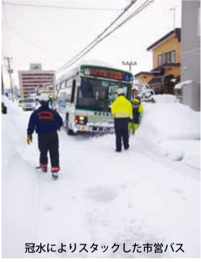
冠水によりスタックした市営バス

現在、市の担当課(都市整備部・道路維持課)は、流・融雪溝管理組合と交流も改善策の話し合いも行っていないと聞きました。